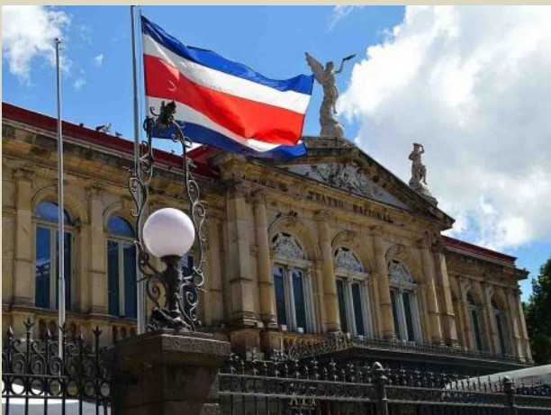
Teatro Nacional de Costa Rica.

Septiembre, mes patrio para México, Costa Rica y Centroamérica.