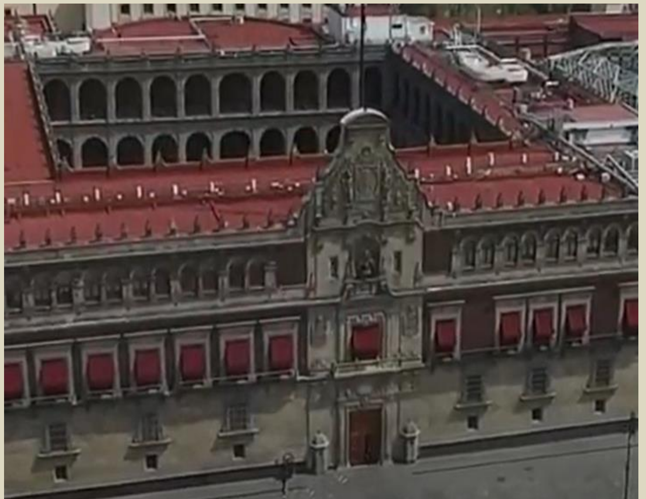
Palacio Nacional. CDMX.